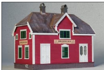
Ørgenvika stasjon, fra Norske Modeller.

Norske Modeller · Norske Modeller tilbyr verktøy, byggedeler og byggesett for de som ønsker å gjenskape norsk jernbane i modell. Byggesettene er primært laget av laserskåret treverk.